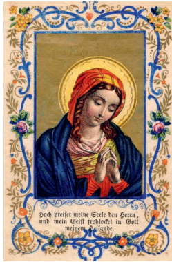
Heiligenbild aus den 1860er-Jahren.

«Aus der Not geboren», Landesmuseum Zürich, noch bis 20. April