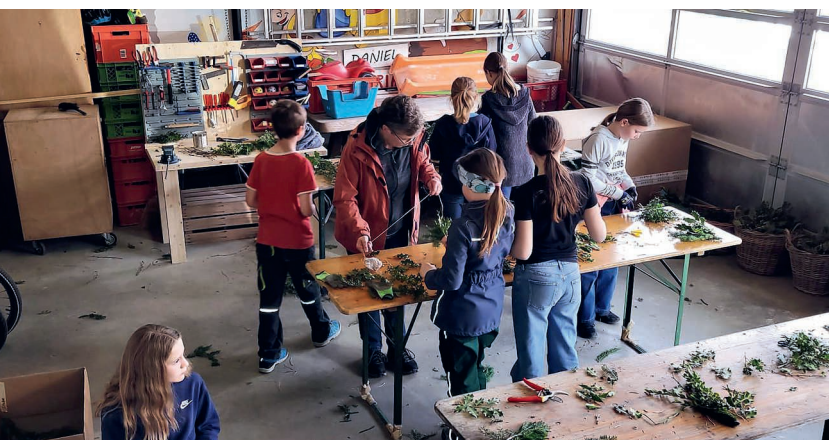
Die Minis beim Binden der Palmzweige.