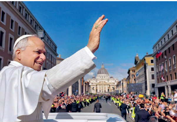
Papst Leo hat ein dichtes Reiseprogramm vor sich.

Als nächste Schritte folgen die Traktandierung in der Synode durch den Synodalrat sowie die Genehmigung durch die Synode. Der Vollzug ist anschliessend auf den 1. Januar 2027 vorgesehen.