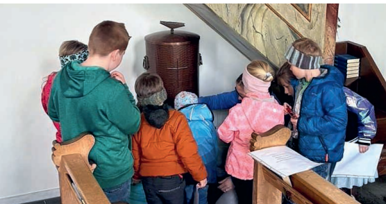
Die Kinder beim Abfüllen des Weihwassers in die selbstgestalteten Fläschchen.