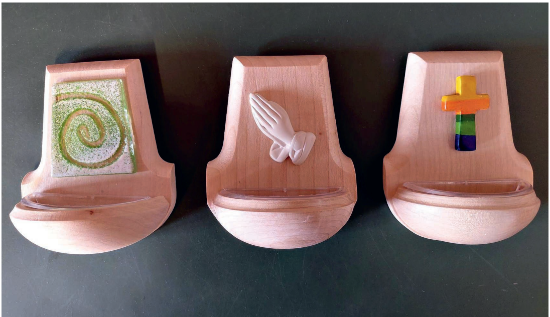
Verschiedene Weihwassergefäße aus Holz und Porzellan.