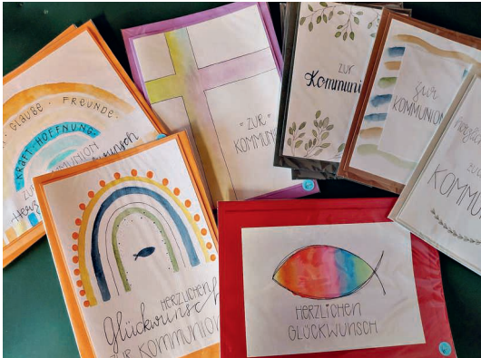
Selbstgestaltete Karten für Erstkommunion, Firmung und Trauer sind Bestandteil des Sortiments.

Schauen Sie gerne vorbei – wir freuen uns auf Ihren Besuch.