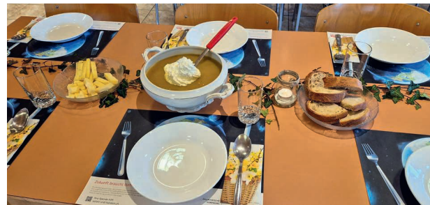
Der liebevoll gedeckte Tisch mit der feinen Suppe.