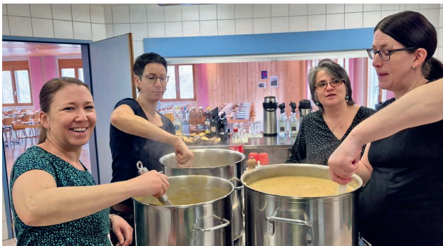
Die Frauen der Missionsgruppe beim Kochen der Suppen.