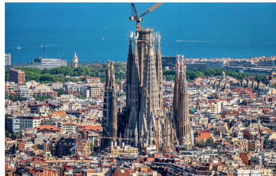
Seit 1882 im Bau: Sagrada Família in Barcelona.

Mit dem Aufsetzen des ersten Kreuzsegments hat der Kirchturm der Sagrada Família (162,9 m) in Barcelona jenen des Ulmer Münsters (161,53 m) überholt. Damit ist die endgültige Höhe von 172,5 Metern erreicht, obschon das Werk des katalanischen Künstlers Antonio Gaudí nach wie vor nicht fertig ist. Gaudí legte fest, dass die Kirche den höchsten Hügel von Barcelona (177 m) nicht überragen dürfe.