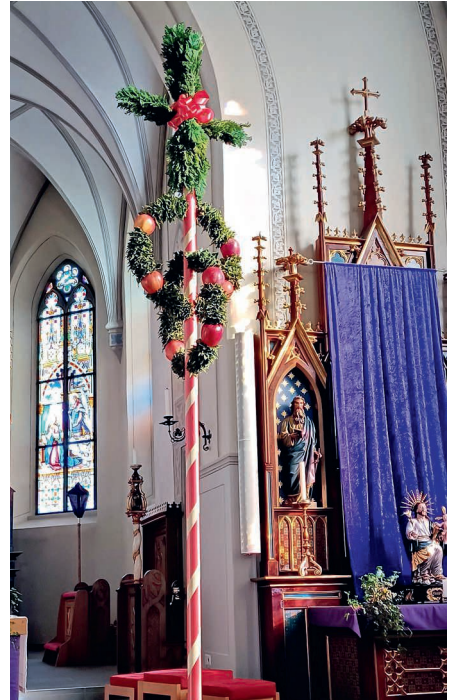
Der festlich geschmückte Palmbaum in der Pfarrkirche St. Nikolaus.

Die fertigen Palmbündel werden in der Messfeier am Palmsonntag gesegnet und anschliessend an die Gottesdienstbesucher verteilt.