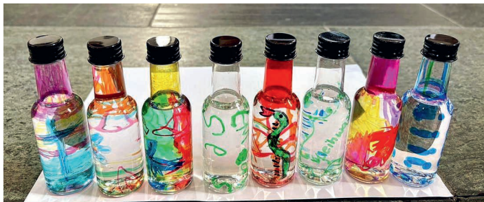
Die hübsch verzierenen Weihwasserfläschchen.