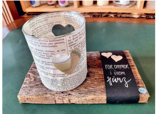
Ein selbstgestaltetes Windlicht für schwere Zeiten.